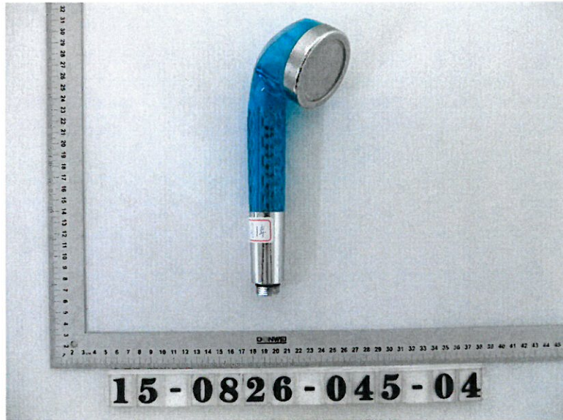
TUV No. 15-0826-045-04